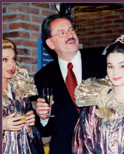
OB Christian Ude mit Ensemblemitgliedern